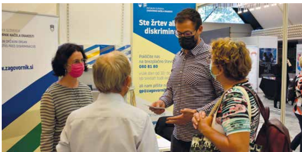
A Hivatal szakértő munkatársai a kiállítóteremben tájékoztattak, tanácsot adtak, növelték a tudatosságot és bemutatták az intézmény munkáját.

A Hivatal szakértő munkatársai a kiállító teremben tájékoztattak, tanácsot adtak, növelték a tudatosságot és bemutatták a testület munkáját. A hangsúly a résztvevők tájékoztatásán volt az életkoron alapuló diszkrimináció elleni védekezés lehetőségeiről. Lehetőségük volt elolvasni egy szórólapot, ami a Hivatalt mutatja be, egy formanyomtatványt a diszkrimináció feljelentéséhez, a különleges jelentéseket és a Hivatal éves jelentését.